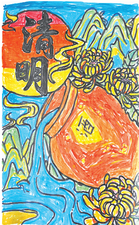
小记者:孟奕彤 三(3)班 辅导老师:阮伟