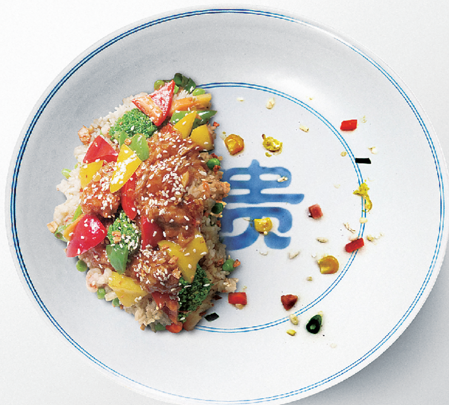
俭以养德 杜绝奢奢