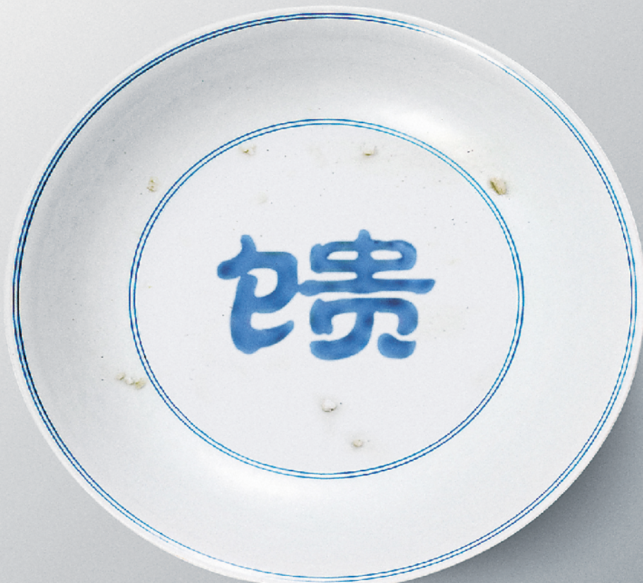
大地馈赠 拒绝浪费